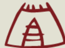
Saamenkielen ja saamelaiskulttuurin kehittäminen