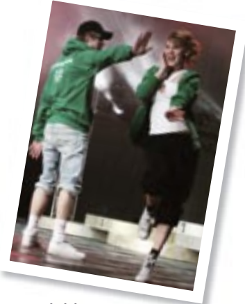
Sakulainen liikkuja s. 6