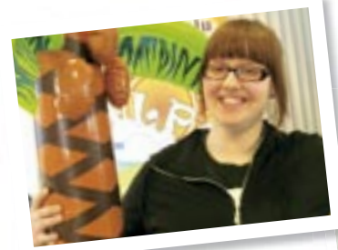
Vuoden tutor s. 8