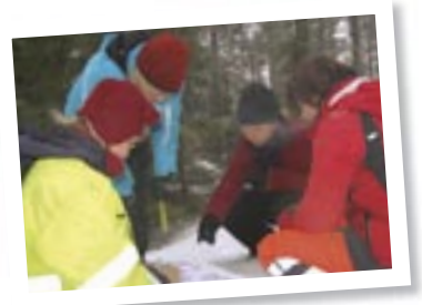
Kuerkievaria kehittämässä s. 28