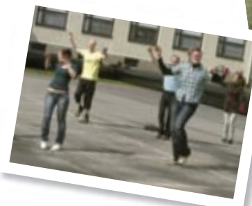
Sedu on the road s. 27