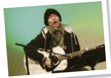
SAKUstara s. 4