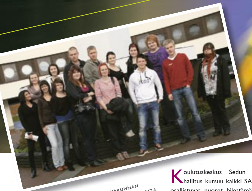
KOULUTUSKESKUS SEDUN OPISKELIJAKUNNAN HALLITUKSEN JÄSENET TUNNISTAT POHJALAISUUSTA SAKUstars-BILEILTANA KE 14.4.