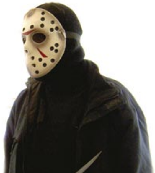
UPEITA MASKEJA NÄHTIIN FANTASIANÄYTELMÄSSÄ ÄLÄ UNTA NÄÄ.