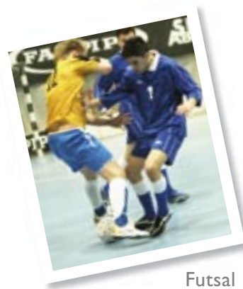
Futsal s. 20