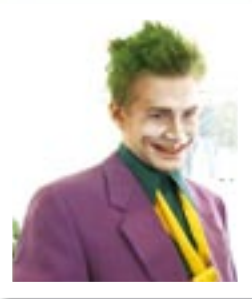
Harrastuksesta ammattiin s. 16