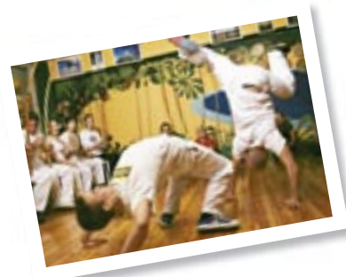
Nuorten akademia s. 12