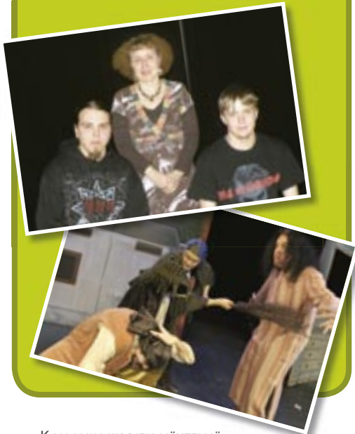
KAJAANIN KISOJEN NÄYTELMÄ KERTOI PORVOON VUODEN 1760 TULIPALOSTA.